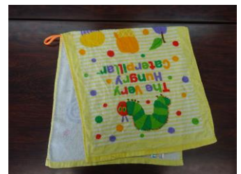
寄付用手ふきタオル