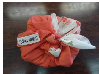
パジャマ用風呂敷（年長のみ）