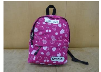
3才~5才児リュックサック