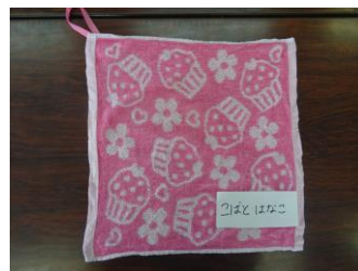
3~5才児 手ふきタオル