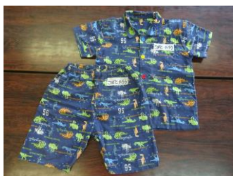
パジャマ（年長のみ）